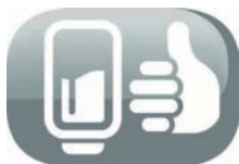
Ouverture main propre