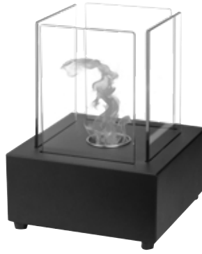
Fig 2 FFB 022