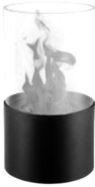
Fig 1 FFB 017