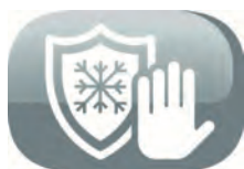
Fonction hors gel