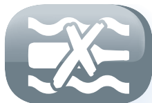
Protección contra vibraciones