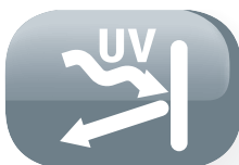
Puerta de cristal anti rayos U.V.