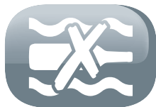
Protección contra vibraciones