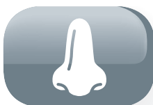
Filtro anti olores