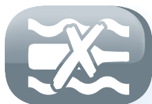
Protección contra vibraciones

La vinoteca Qlima es de alta calidad con sus detalles en acero inoxidable.