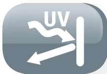
Puerta de cristal anti U.V.