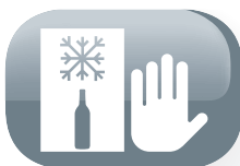
Utilizable en climas fríos