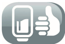
Ouverture main propre