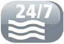
Possibilité de drainage permanent