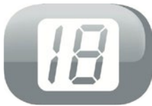
écran de contrôle LCD