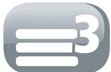
Filtro de 3 capas