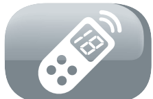
Mando a distancia con pantalla LCD