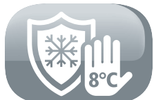
Prevención de congelación del hogar