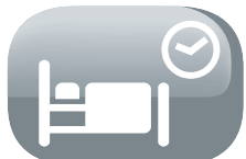
Modo de sueño