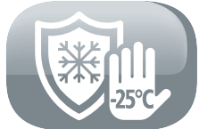
Protección adicional contra las heladas en la unidad exterior.