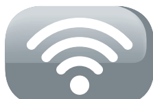
Wireless smart kit