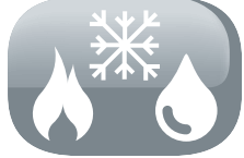
3 funciones en 1